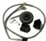
11303005 ENCOM KIT Encoder