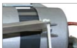
Разблокировочная система с рычагом на кабеле привода