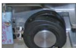
Электронные концевые выключатели