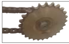
По запросу цепной привод