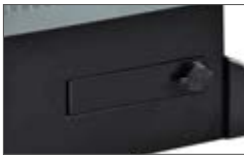
Устройство разблокировки с помощью металлического рычага DIN и крышки замка