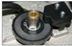
Механическая двухдисковая муфта